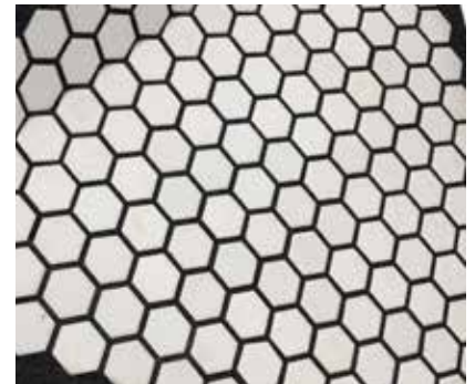
Lechada para láminas de alúmina